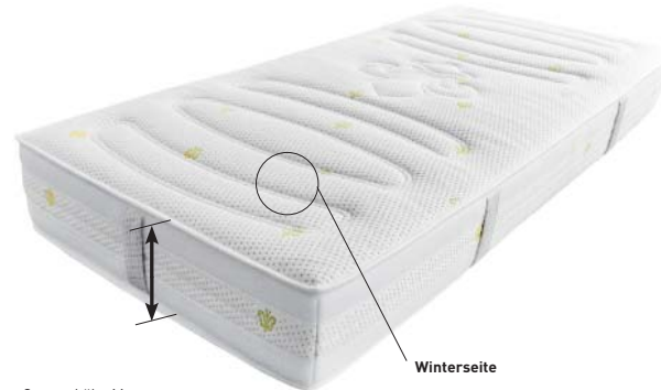
Gesamthöhe Matratze: ca. 24 cm