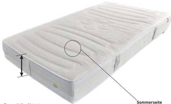
Gesamthöhe Matratze: ca. 24 cm